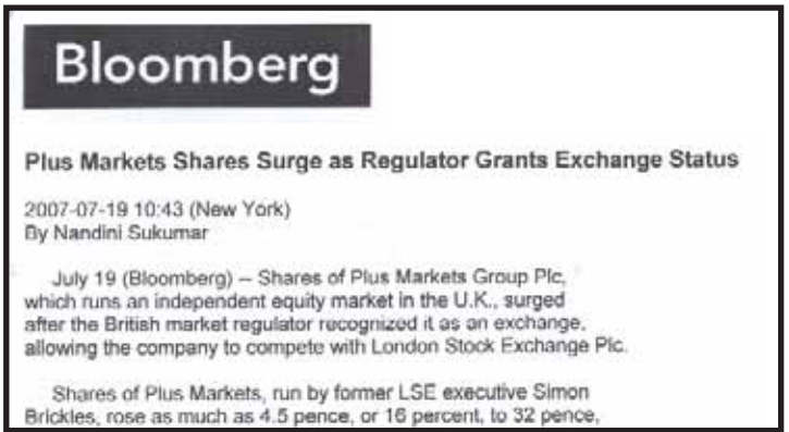
BLOOMBERG: «Οι μετοχές του PLUS εκτοξεύτηκαν. Εκτίθεση της τιμής των μετοχών του PLUS, μετά την ανακρίβειά του ως χρηματιστήριο, επιτρέποντας του να ανταγωνιστεί το LSE»