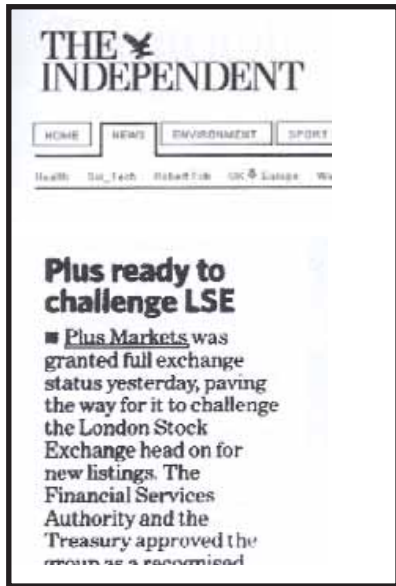
THE INDEPENDENT: «Το PLUS είναι έτοιμο να αναμετρηθεί με το LSE. Η Αγορά του PLUS κατατάσσεται απόλυτο χρηματιστηριακό κύρος, ανοίγοντας το δρόμο για την αναμέτρηση με το LSE στην εγγραφές νέων εταιρειών»