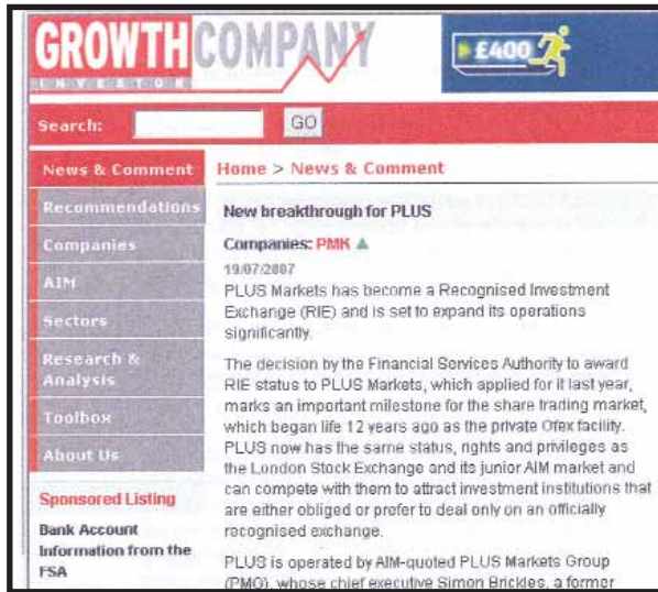
GROWTH COMPANY INVESTOR: «Νέο ρεκόρ για τον PLUS. Το Αγορά του PLUS είναι πλέον μια αναγνωρισμένη επενδυτική χρηματιστορική και επεκτείνει σημαντικά τις δραστηριότητές της»