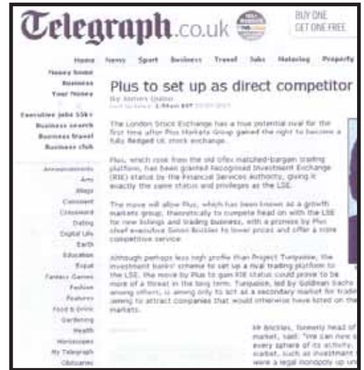
THE TELEGRAPH: «Το PLUS προετοιμάζεται για ευθεία ανταγωνισμό με το LSE. Το Χρηματιστήριο του Λονδίνου αποκτά ένα αληθινό αντίπαλο για πρώτη φορά, μετά την αναγνώριση του Plus Market Group ως πλήρους βρετανικής χρηματιστηριακής αγοράς».