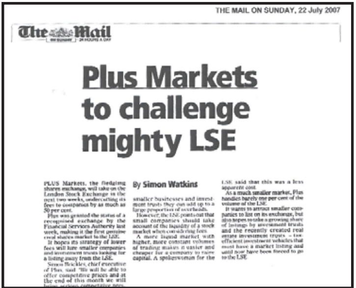
THE MAIL ON SUNDAY: «Η Αγορά του PLUS προκαλεί δυναμικά το LSE. Η Αγορά του PLUS, η ανερχόμενη χρηματιστηριακή αγορά, θα ξεπεράσει το Χρηματιστήριο του Λονδίνου τις επόμενες δύο εβδομάδες, μειώνοντας τις χρεώσεις του προς τις εταιρείες έως και 50%»